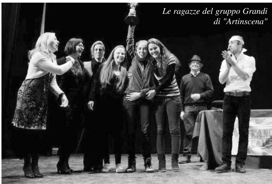
Le ragazze del gruppo Grandi di "Artinscena"

I lettori dei quotidiani di Novara dello scorso mese di marzo avranno forse avuto modo di meravigliarsi e porsi persino quell'interrogativo di manzoniana memoria. Ma chi son costoro e da dove vengono quelle brillanti ragazze?