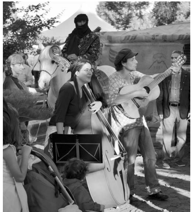
Un'istantanea dall'entrata della "Festa nel deserto"

bambini si sono impegnati a vendere i biglietti della riffa ed i loro prodotti, mentre vari artisti di strada si sono alternati per intrattenere il folto pubblico che ha risposto in maniera positiva anche con la sottoscrizione di molti libretti di patrocinio. Tra i presenti c'è chi ha voluto preservare un ricordo scattando una fotografia con i vestiti